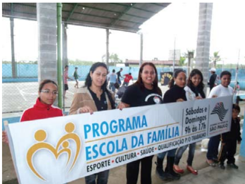
Alunos da FABE na Escola estadual de Vicente de Carvalho II fotografados em 2011 para o Jornal da FABE

os bolsistas financiam seus estudos implementando atividades esportivas, culturais e educacionais nas escolas públicas da cidade aos finais de semana